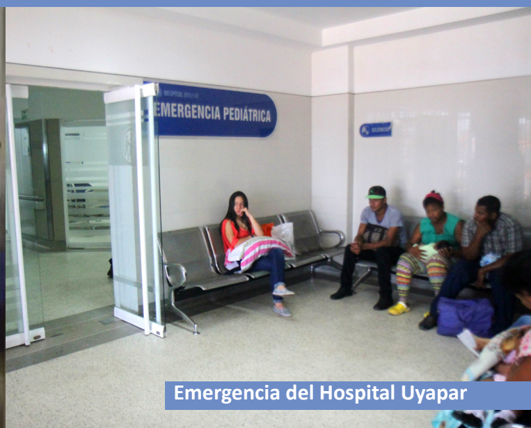
Emergencia del Hospital Uyapar